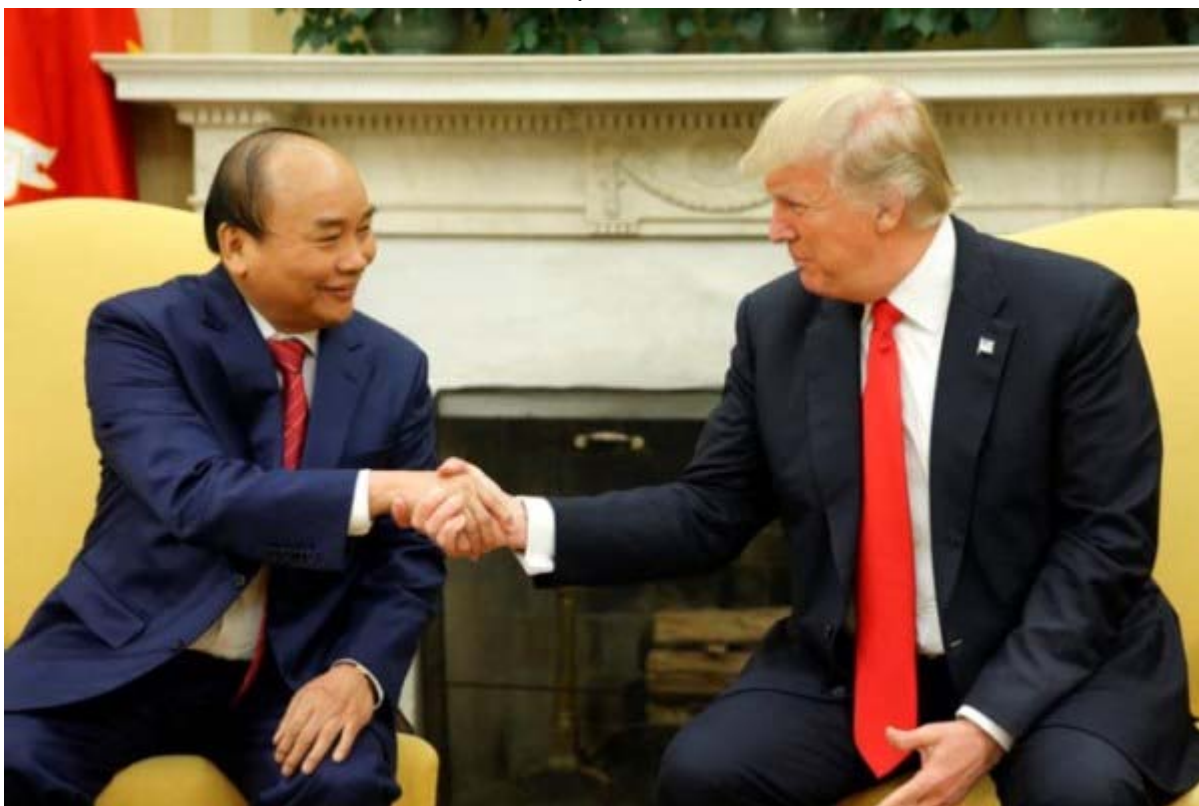
Thủ tướng Nguyễn Xuân Phúc tại Tòa Bạch Ốc