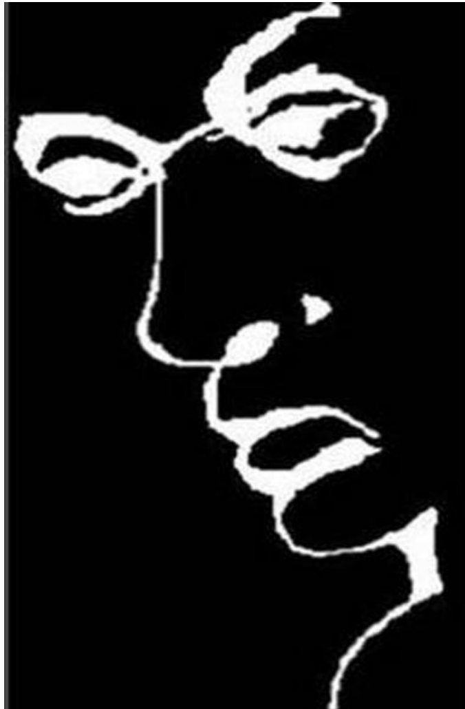
Chữ “LIAR” viết thành hình mặt người!