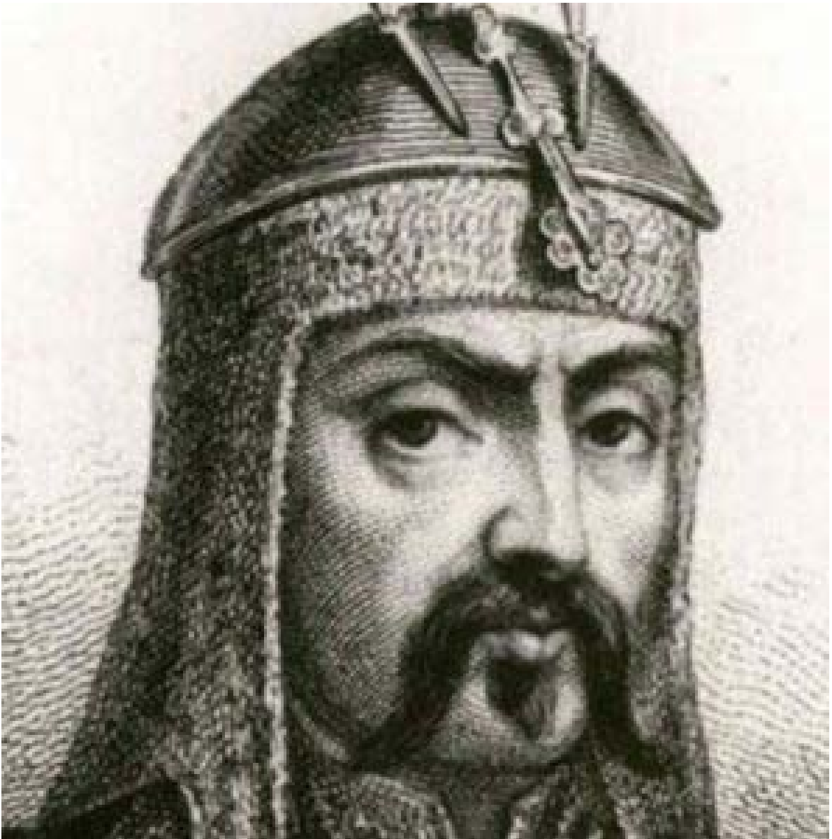
Ảnh Genghis Khan vẽ bởi người Âu châu [2]