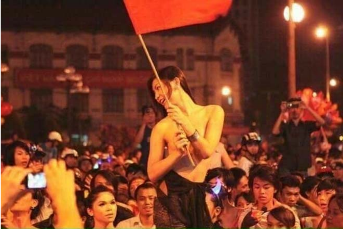
Tuổi trẻ Việt Nam mừng “bóng đá” U23

Gần đây, qua sự thành công (và thất bại – không phải thất thắng?) của cầu thủ “bóng đá” của Việt Nam trong giải “Châu Á U23,” ban Tuyên huấn Trung ương đảng csvn đã dùng cái nghịch lý muôn đời của tư duy cộng sản để thổi ống đu đu vào cái hoang tưởng gọi là “ dấu hiệu của vận nước đang lên... ” làm nhiều người thường dân nam bộ (như tôi) phải ngạc nhiên thốt ra: “ WTF? Ái chà! Cái củ cái gì vậy hả? Kết quả của một vài trận bóng đá có gì ăn nhậu với chuyện vận nước đang lên hay xuống. Thiệt tình! Chỉ có đảng csvn mới có đủ tư cách làm chuyện bôi bác loại này. ”