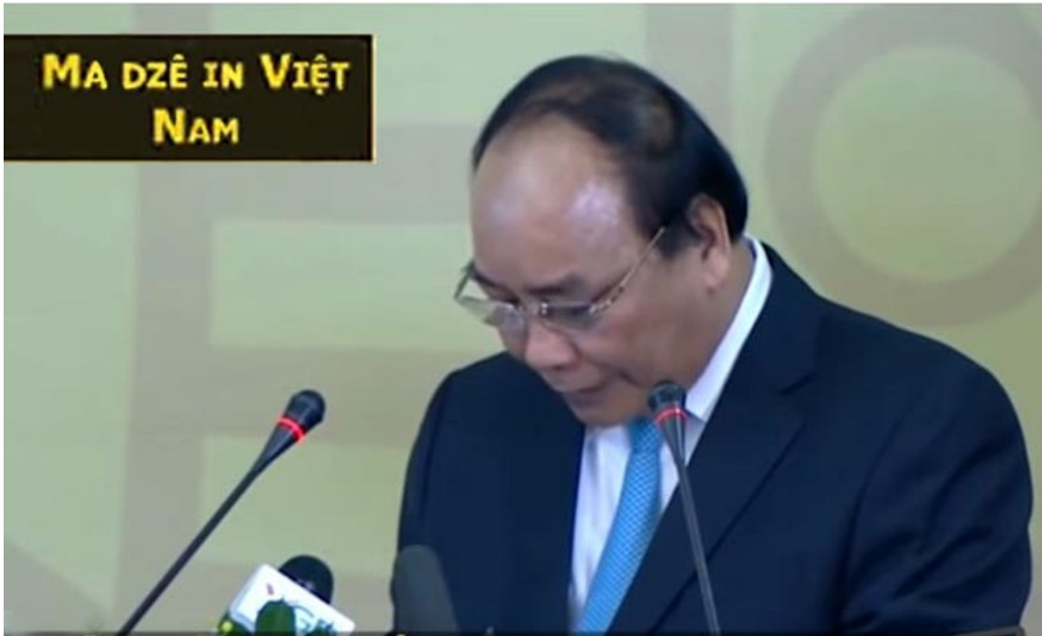
Thủ tướng “Cờ Lờ Mờ Vờ” “Ma dzê in Việt Nam”

Thủ tướng vi-xi Nguyễn Xuân Phúc (aka Nguyễn Xúc Phân) là bà con của nghệ sĩ Minh Béo, dân Việt ta còn gọi ông Phúc là ông “Cờ Lờ Mờ Vờ” Nguyễn Xuân Phúc ... What the phuck? Nói đến Thủ tướng NXPhúc là phải nói đến cái khả năng ngoại ngữ trót quớt của ông ta.