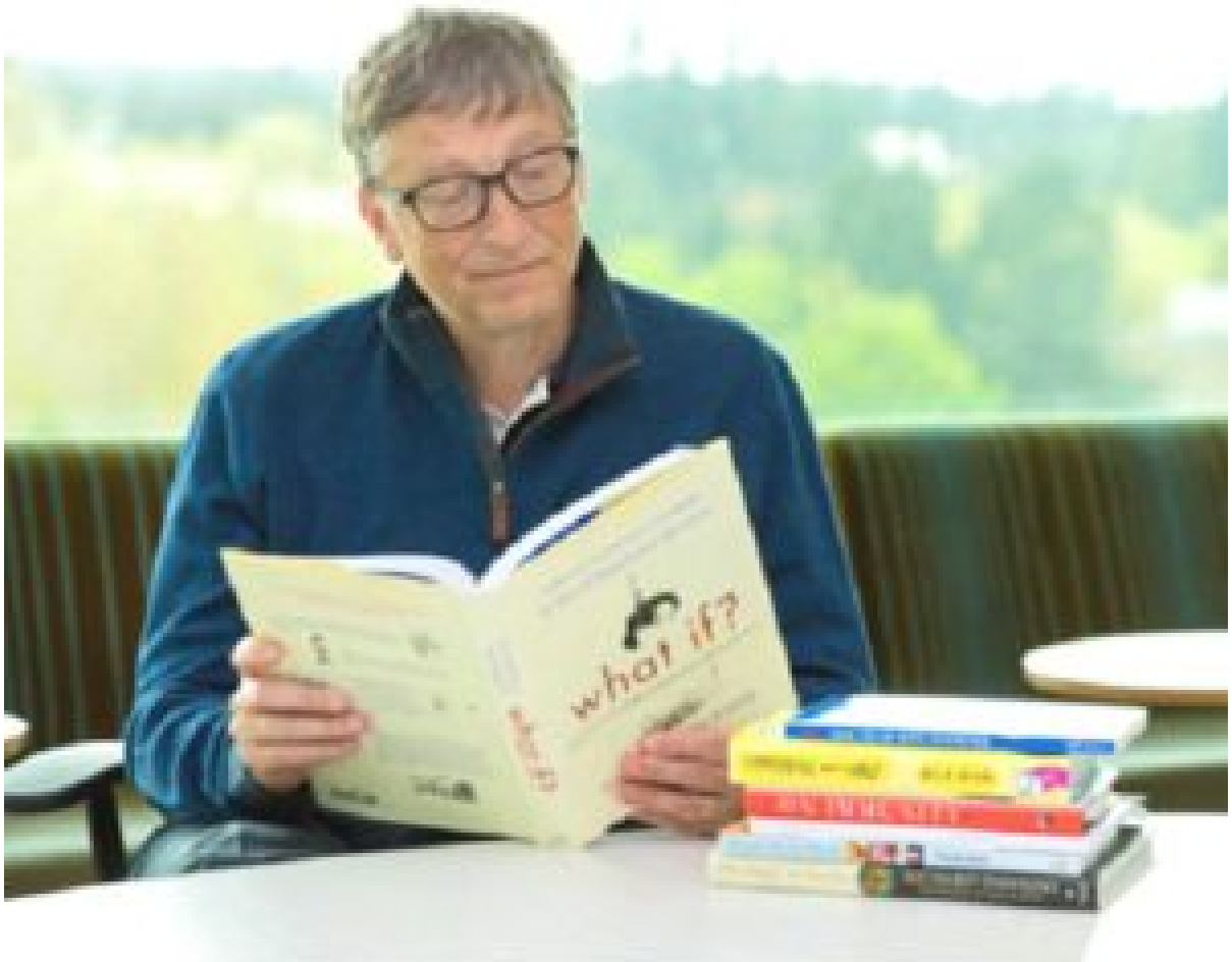
Ông Bill Gates đọc sách