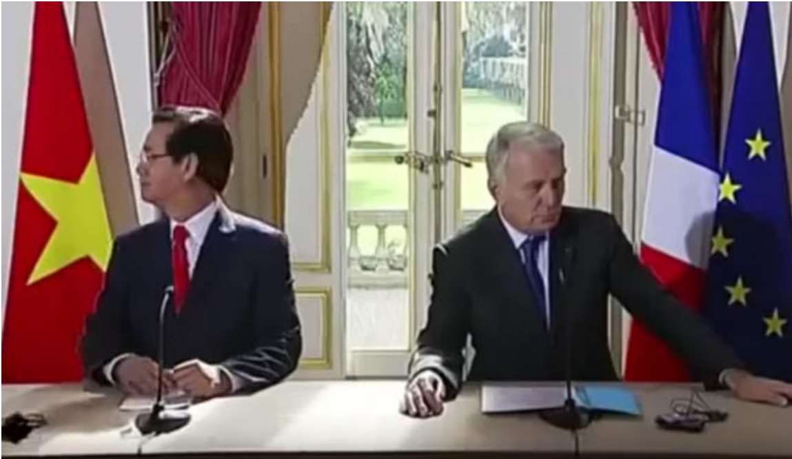
Thủ tướng Nguyễn Tấn Dũng họp báo với Thủ tướng Pháp “Giăng-mắc-ê-rô”- Jean Marc Ayrault

Ngày 23/9/2013, Thủ tướng Nguyễn Tấn Dũng đến thăm nước Pháp để bàn về vấn đề Hợp tác kinh tế trong quan hệ Việt Nam - Pháp. Pháp là đối tác thương mại Âu châu lớn thứ 3 của Việt Nam (sau Đức và Anh quốc). Về số lượng đầu tư tính ra Mỹ kim, số vốn Pháp đầu tư vào Việt Nam, tính từ năm 1988 cho đến 31/12/2012, đứng hàng thứ 2 trong số các nước Âu châu (sau Hoà Lan) và đứng thứ 15 trong tổng số 92 các quốc gia có đầu tư vào Việt Nam.