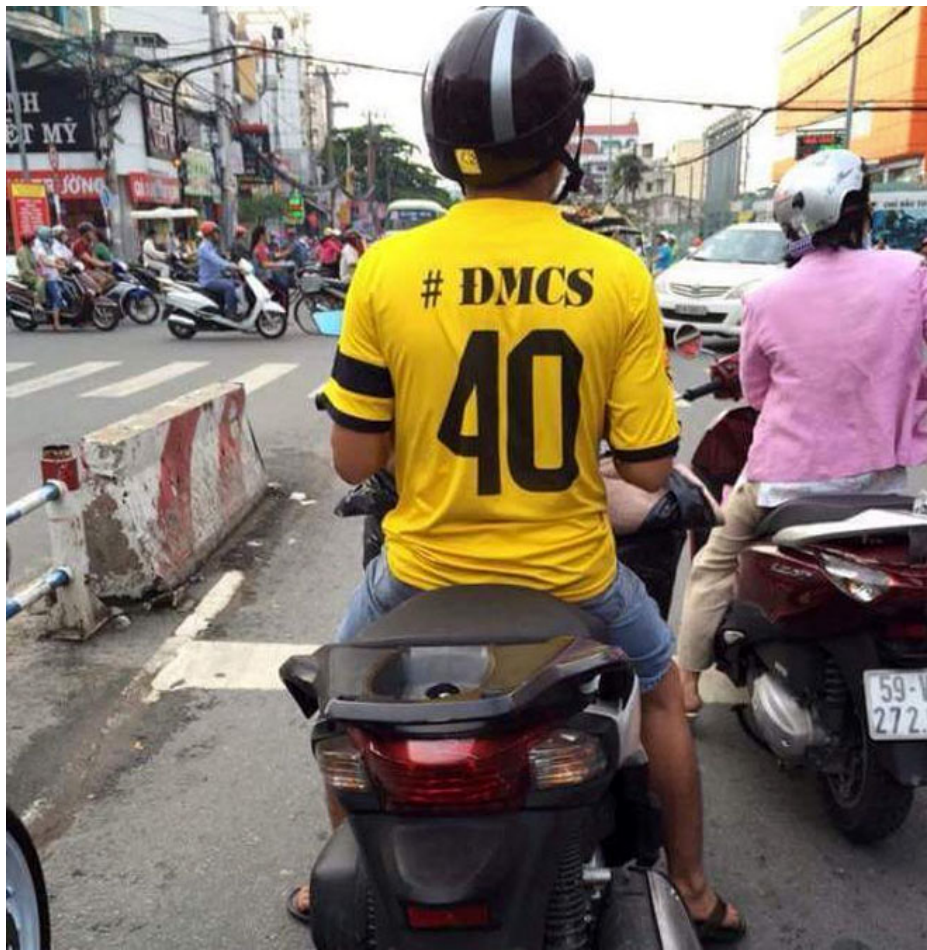
Dân mang áo với khẩu hiệu “ĐMCS” ở Việt Nam