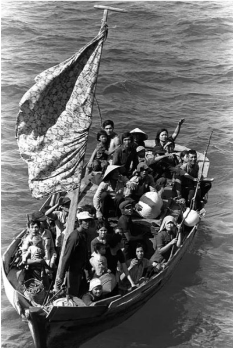
Thuyền nhân Việt Nam tị nạn cộng sản

chân dân Hoa kỳ hay là phải tìm cách ngăn cản dân chúng đừng bỏ nước ra đi...”