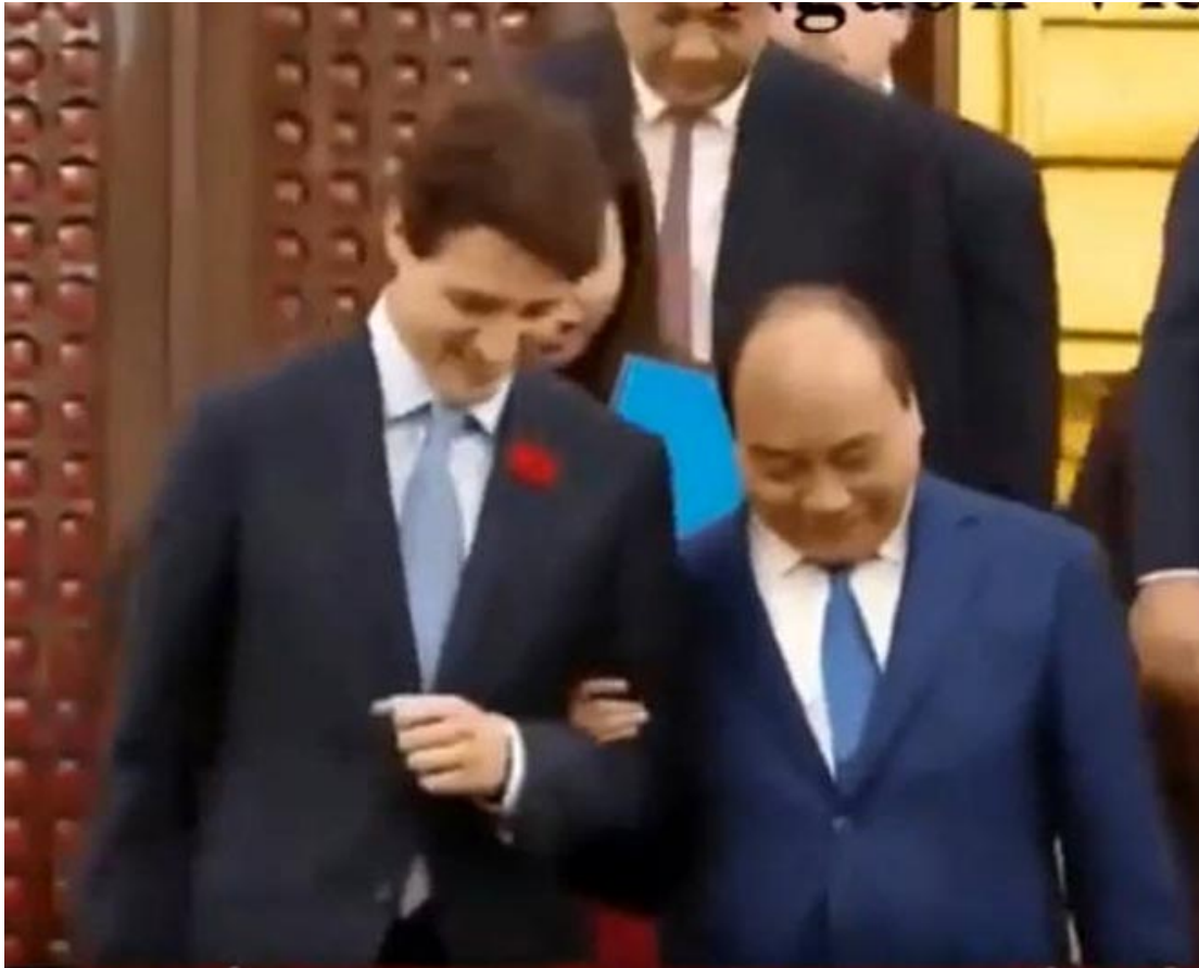
Thủ tướng Nguyễn Xuân Phúc âu yếm (?!) ôm cánh tay Thủ tướng Canada Justin Trudeau

- Ngày 8/11/2017, Thủ Tướng Canada Justin Trudeau đến thăm thân hữu Việt Nam trong 3 ngày, được Thủ tướng Việt Nam Nguyễn Xuân Phúc tiếp đón một cách kỳ lạ buồn cười té ghe luôn (phải nói là xấu hổ với quốc tế). Không hiểu đỉnh cao trí tuệ đảng ta tìm ra ở đâu kiếm ra cái kiểu quàng tay rồi nắm tay âu yếm bước đi chung vậy trời ạ. Không thể tin là chuyện có thật dù có hình ảnh và video thật. Ôi thôi xấu hổ quá giờ! Nhưng cũng nên biết thêm TT Phúc có dây thần kinh xấu hổ ở đâu đã được phẫu thuật rút ra từ lâu rồi cho nên đầu Thủ tướng “bị” ngoéo qua một bên!