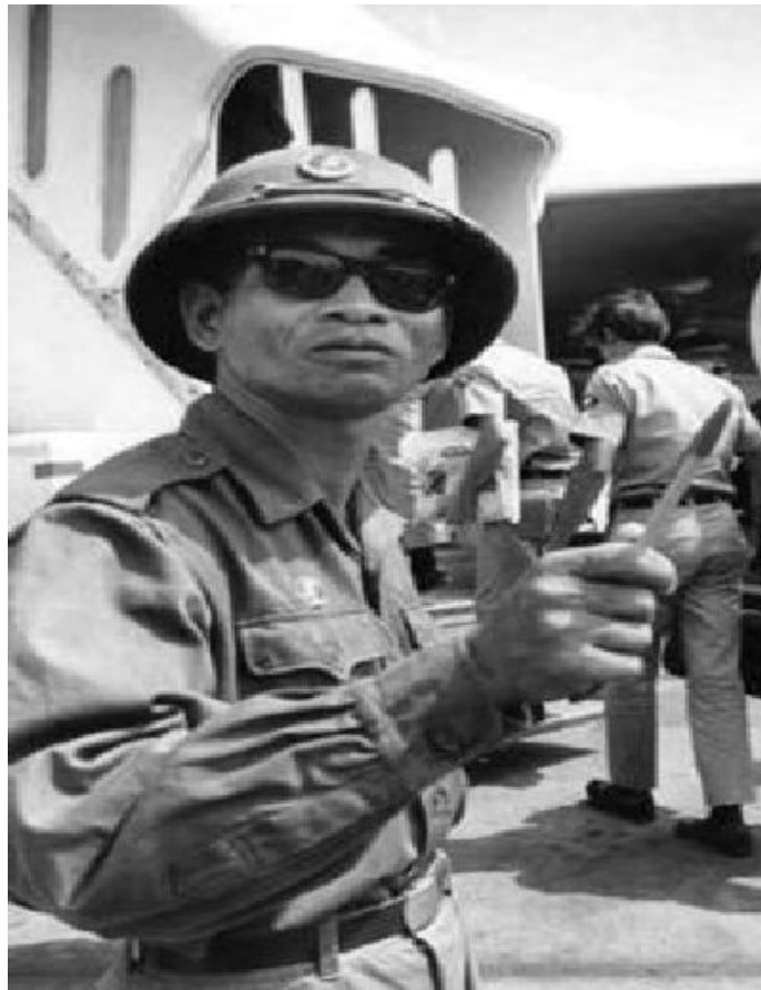
Một anh Việt cộng