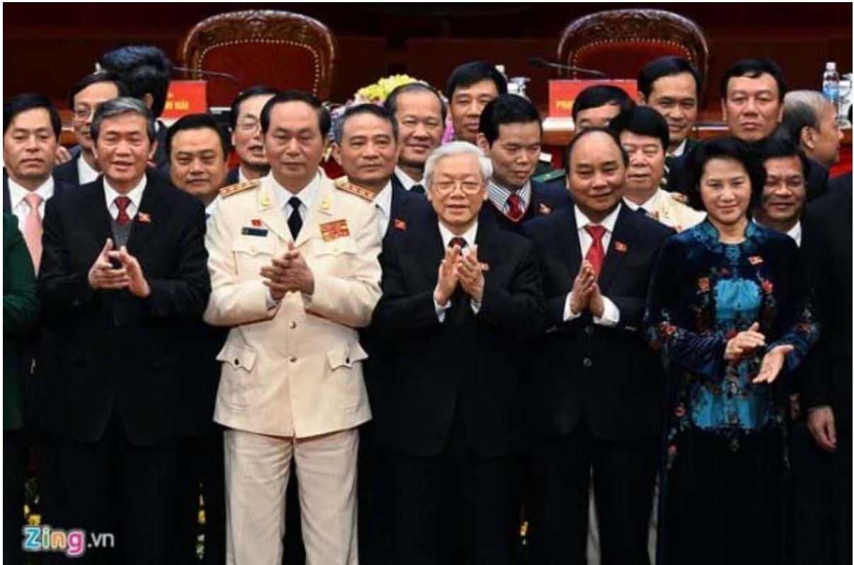
Bộ Chính Trị đảng CSVN Khóa 12