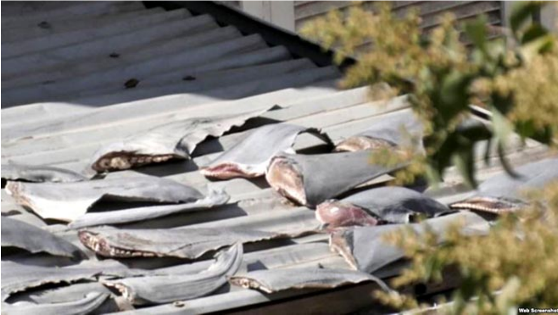
Vi cá phơi trên nóc nhà ông ĐSQ Việt Nam ở Chile, Nam Mỹ