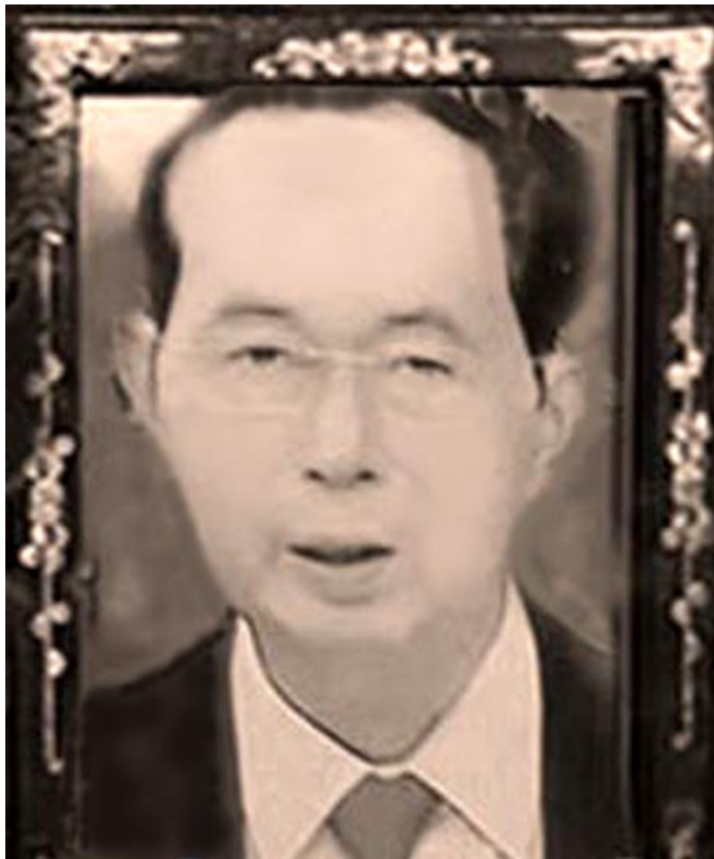
Trần Đại Quang (1956?-2018)