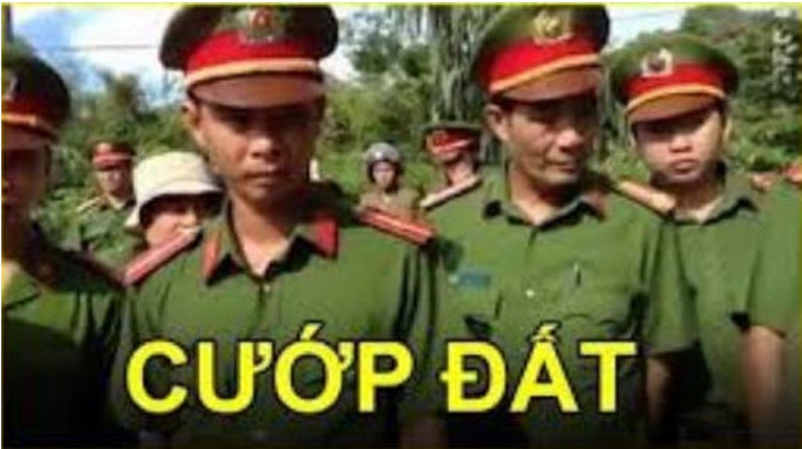
Chỉ tài Cướp và... Cướp

Một đặc sản tuyệt vời khác của đảng csvn là (ăn) cướp: Cướp chính quyền, cướp đất, cướp tư sản, cướp “chẳng chừa cái gì của dân...”