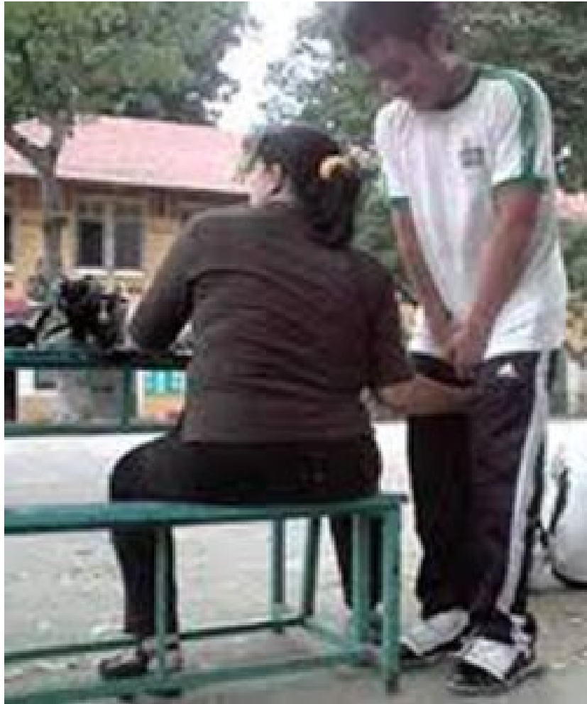
Cô giáo Việt bóp d. học trò trong sân trường!?)

Buổi sáng mai hôm ấy, một buổi mai đầy sương thu và gió lạnh, mẹ tôi âu yếm nắm tay tôi dẫn đi trên con đường làng dài và hẹp. Con đường này tôi đã quen đi lại lắm lần, nhưng lần này tự nhiên thấy lạ. Cảnh vật chung quanh tôi đều thay đổi, vì chính lòng tôi đang có sự thay đổi lớn: hôm nay tôi đi học.