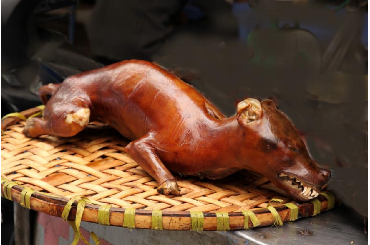
Chó thui ở Việt Nam