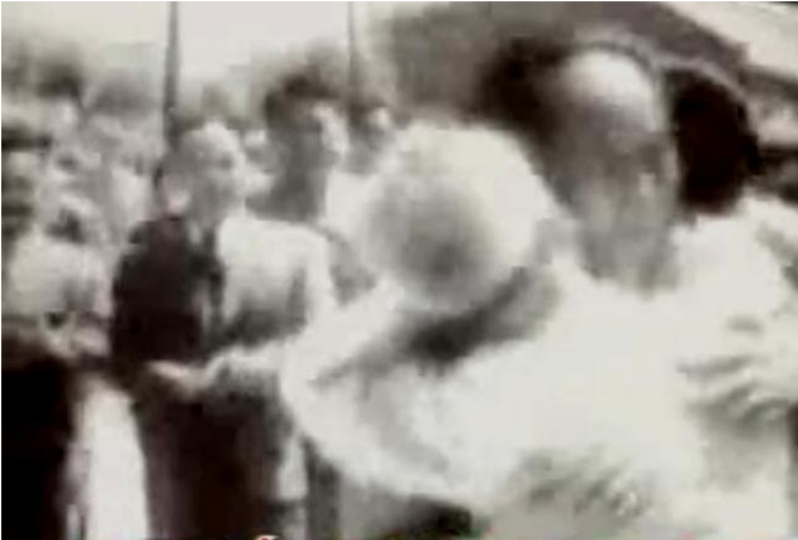
HCM ôm hôn thắm thiết chủ tịch TC Mao Trạch Đông

- Hồ Chí Minh (chủ tịch nhà nước VN) ôm hôn thắm thiết Mao Trạch Đông (chủ tịch nhà nước Trung cộng) trong chuyến thăm Trung cộng ngày 3/6/1955. Nên biết bác sĩ riêng của Mao Trạch Đông là bác sĩ Lý Chí Thỏa đã viết trong một hồi ký của ông ta là Mao Trạch Đông rất ít khi tắm rửa và gần như không bao giờ đánh răng (!) Hàm răng của Mao Trạch Đông có một lớp bựa màu xanh rất dày?! HCM ôm hôn bên trái, Mao Trạch Đông quay đầu có vẻ hơi vùng vẩy qua bên phải, HCM vít đầu Mao để hôn qua bên phải mà không thấy góm cái mùi hôi của răng bựa màu xanh?! HCM có vẻ thích ôm hôn thắm thiết!