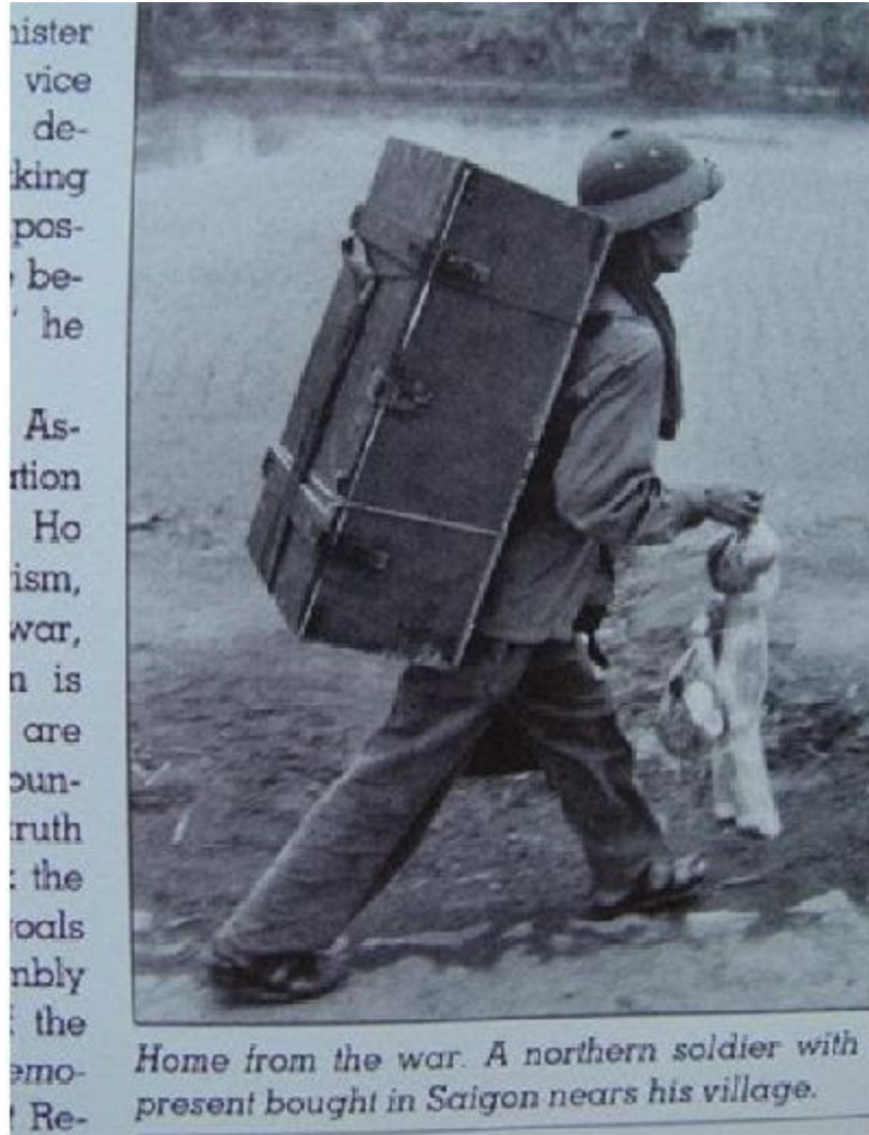
Home from the war. A northern soldier with present bought in Saigon nears his village.

Đây là cách dùng chữ bừa bãi và ngu dốt của bọn cán bộ Việt Cộng. Chủ nào tớ này.