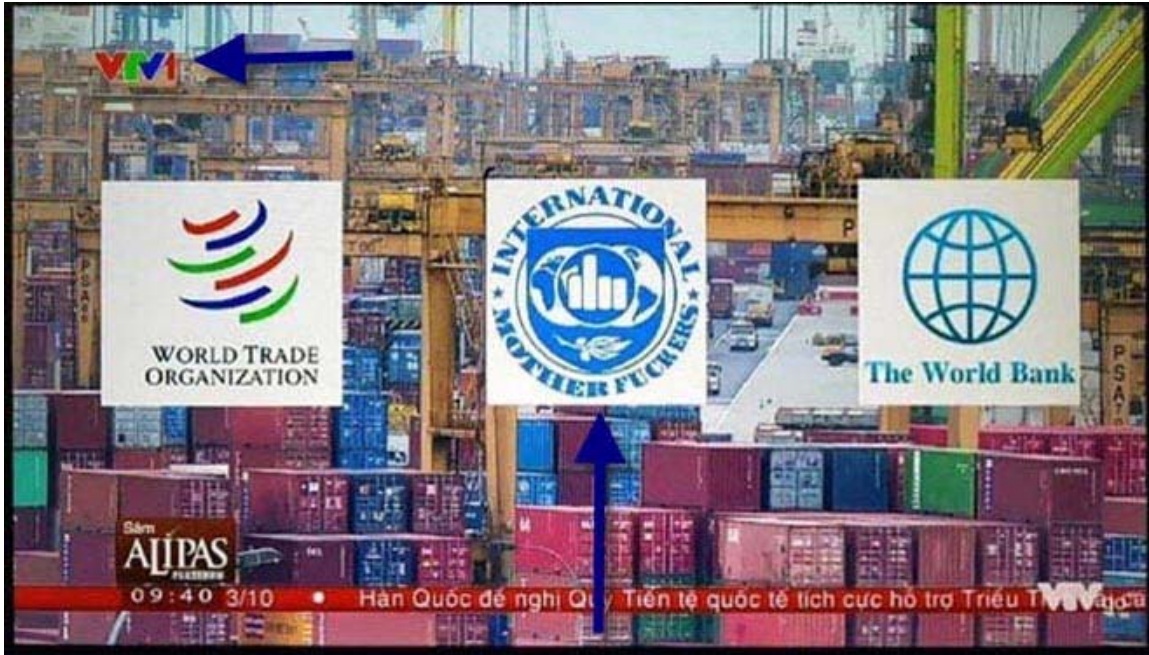
Màn ảnh đài truyền hình quốc gia VTV, Việt Nam

Lúc 9 giờ 30 sáng ngày 14 tháng 10 năm 2018 chương trình Toàn Cảnh Thế Giới của đài truyền hình VTV nước CHXHCNVN ( Chẳng Hề Xấu Hổ Chút Nào Vì Ngu ) đã có bài tường thuật về vai trò của các tổ chức Thương mại Thế giới (WTO), Quỹ Tiền tệ Quốc tế (IMF) và Ngân hàng Thế giới (The World Bank) trong lãnh vực tạo dựng mỗi mậu dịch quốc tế của thế giới tự do.