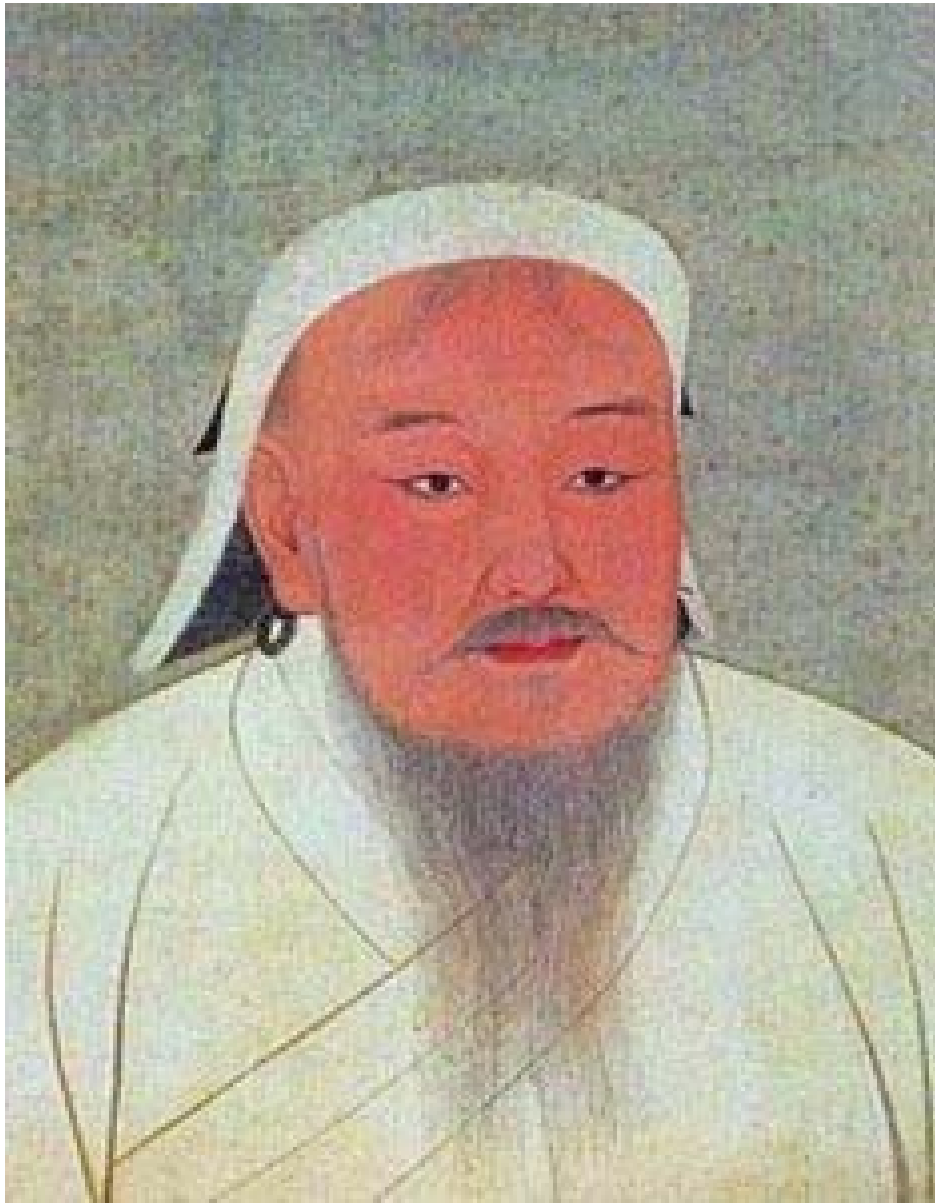
Ảnh Genghis Khan vẽ bởi người Trung Hoa