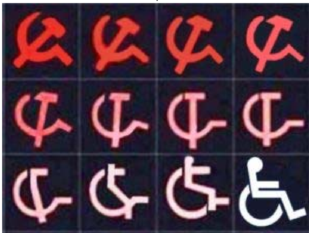
Sự tiến hóa của chủ nghĩa cộng sản