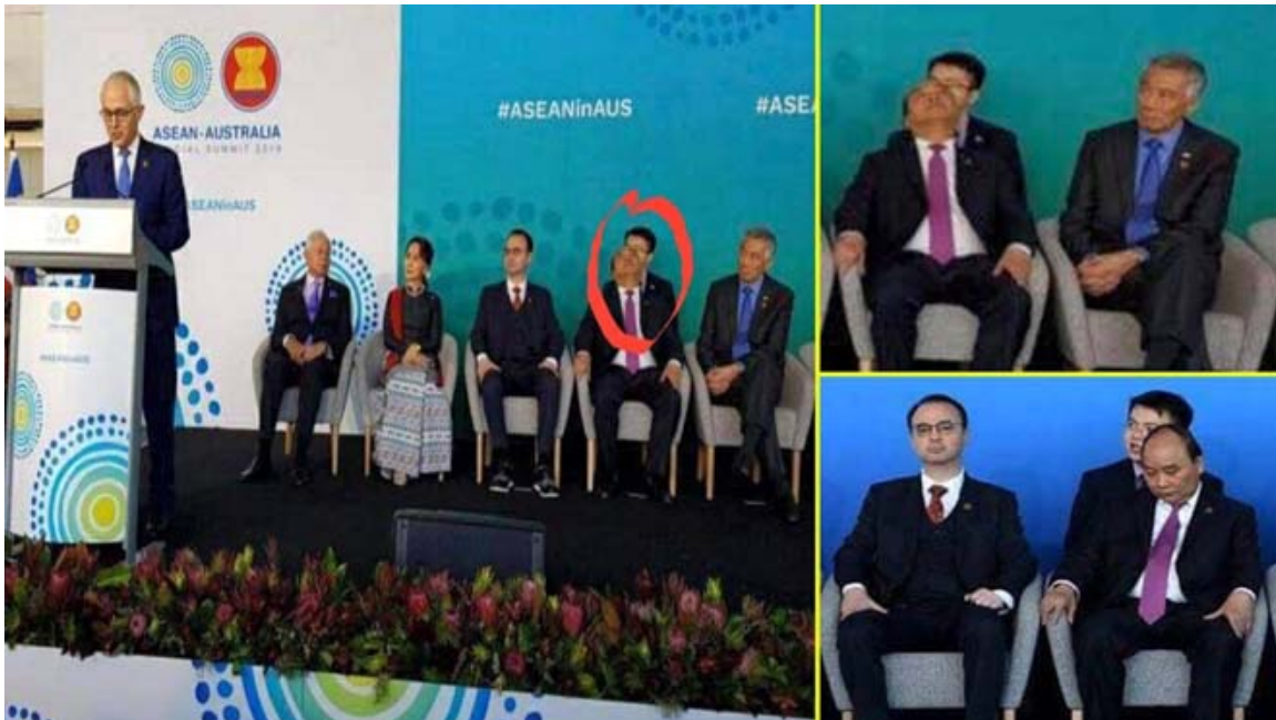
Thủ tướng Nguyễn Xuân Phúc ngủ gật, ngẹo cổ tại Hội nghị thượng đỉnh ASEAN - Úc

Dân Việt đã thấy quan chức cs nào ngủ ngày chưa? Hỏi là trả lời. Thấy Hà rằm qua video, hình ảnh, tin tức trên mạng: Đại biểu quốc hội (loại đảng cử dân bầu) ngủ hàng loạt trong các phiên họp quốc hội. Ủy viên chính phủ cấp bộ trưởng ngủ trong các buổi họp chính phủ. Tham tán sứ quán Việt Nam ở LHQ ngủ ngon lành (còn gỏi tay hả miệng tạo dáng?) giữa buổi điều trần của thủ tướng Iran; Thủ tướng chính phủ đi dự hội nghị ASEAN ở Úc thì ngủ gật (ngồi dạng dân trên ghế, ngửa cổ oặt ra phía sau) trước ống kính của phóng viên quốc tế.