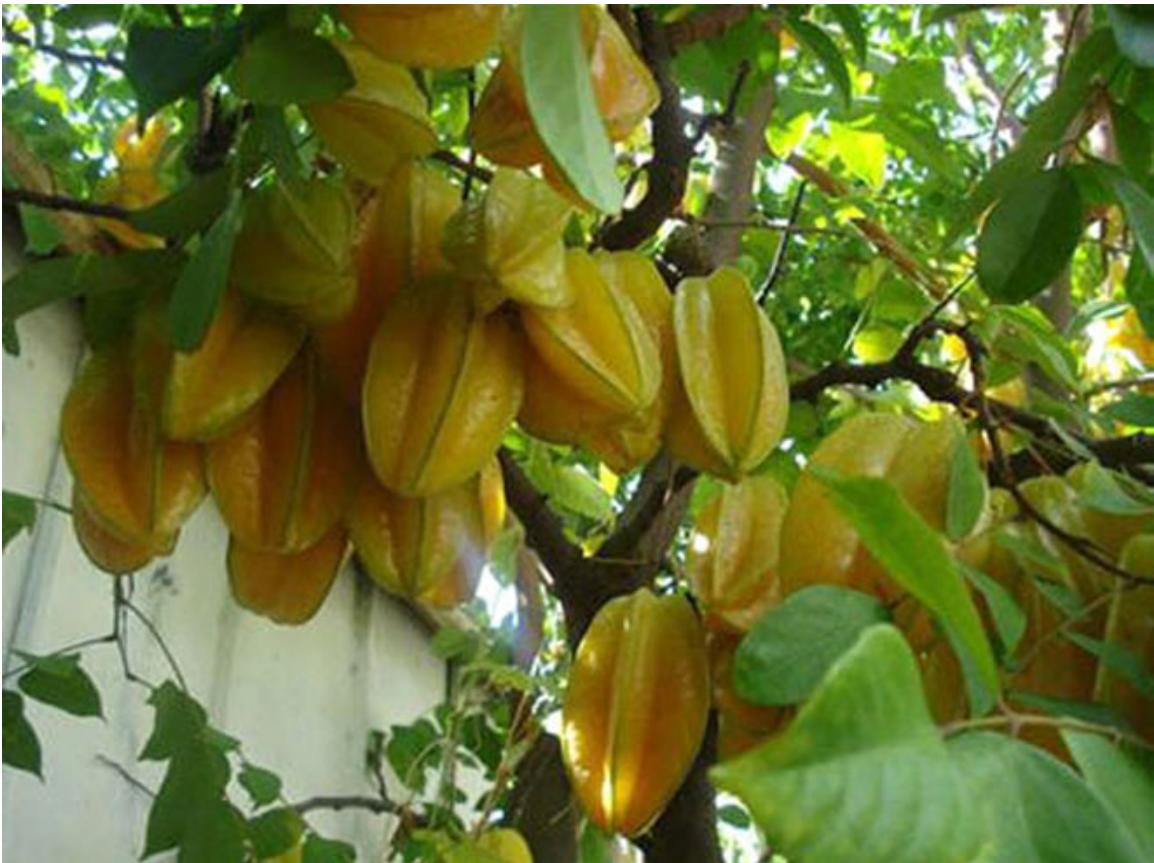
Chùm khế ngọt