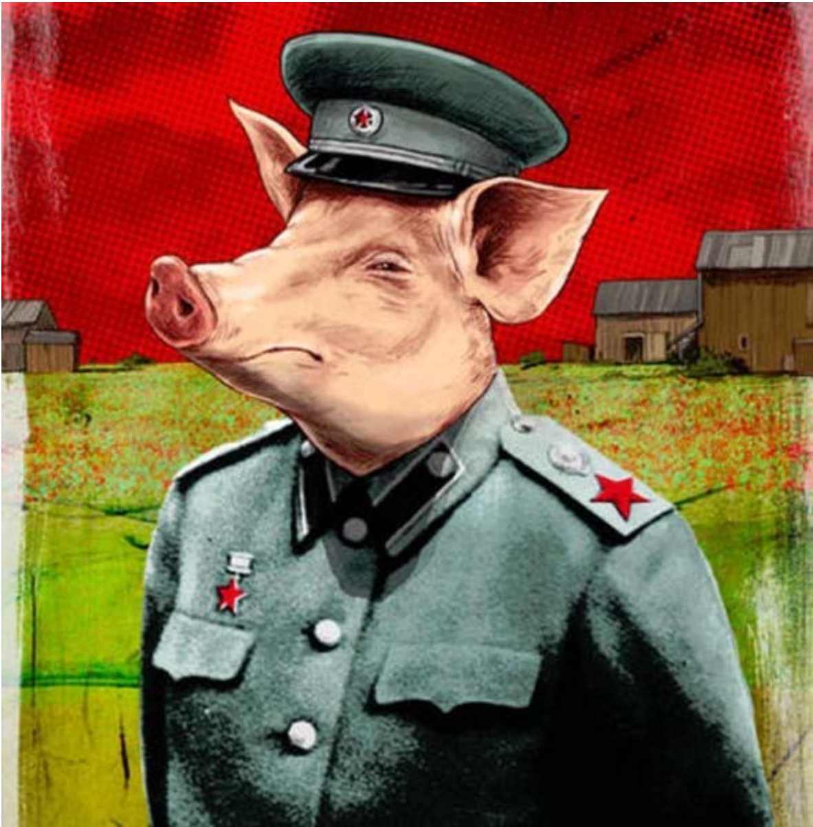
Trại súc vật cộng sản